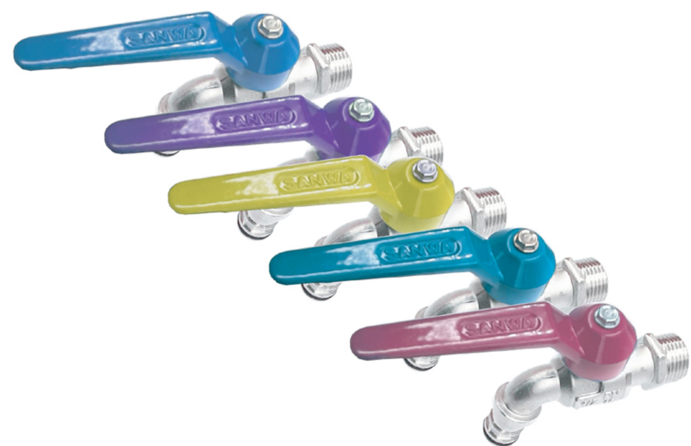
Dimension มิติ (mm.)